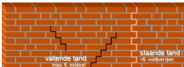
Fig. 1: voorbeeld met vallende en staande tand

Om te voorkomen dat nabij dilataties (met een breedte van 5 mm) de indruk wordt gewekt dat er zeer lange bakstenen zijn toegepast adviseert KNB