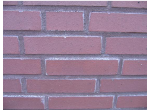
Smetranden door metselmortel

Metselwerk met een permanente waterbelasting (kademuren e.d.) dient eveneens tot boven de hoogste waterlijn te worden doorgestreken.