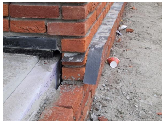
Afbeelding 3: DPC folie net boven maaiveld

Bij gebruik van normaal en sterk zuigende baksteen (klasse IW 3 en IW4) is het advies om één laag boven het maaiveldniveau een waterwerende laag toe te passen om (afb.3).