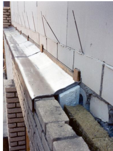
Afbeelding 1. Ondersteuning bladlood met EPS.

Naast het gebruik van bladlood voor horizontale waterkeringen wordt dit vooral ook gebruikt voor het waterdicht aansluiten van metselwerk bij dakdoorbrekingen zoals schoorstenen en aansluitingen van gevelhellingen op verholten goten van daken (zie afb. 2)