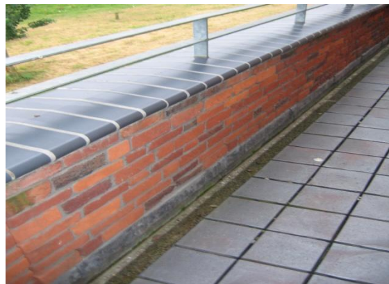
Binnenkant van borstwering die niet of nauwelijks nat wordt

Wanneer men er zeker van is dat het binnenblad van de borstwering nauwelijks nat zal worden is een waterkering tussen beide spouwbladen niet noodzakelijk. Voor de waterdichtheid van de aansluiting met het dak kan dan een loodslabbe worden ingemetseld, die de naad tussen dakbedekking en muur afdekt. Regenwater dat via het buitenspouwblad doorslaat zal net als bij het overige gevelmetselwerk via de luchtspouw zijn weg vinden naar de openstootvoegen ter plaatse van de waterkeringen.